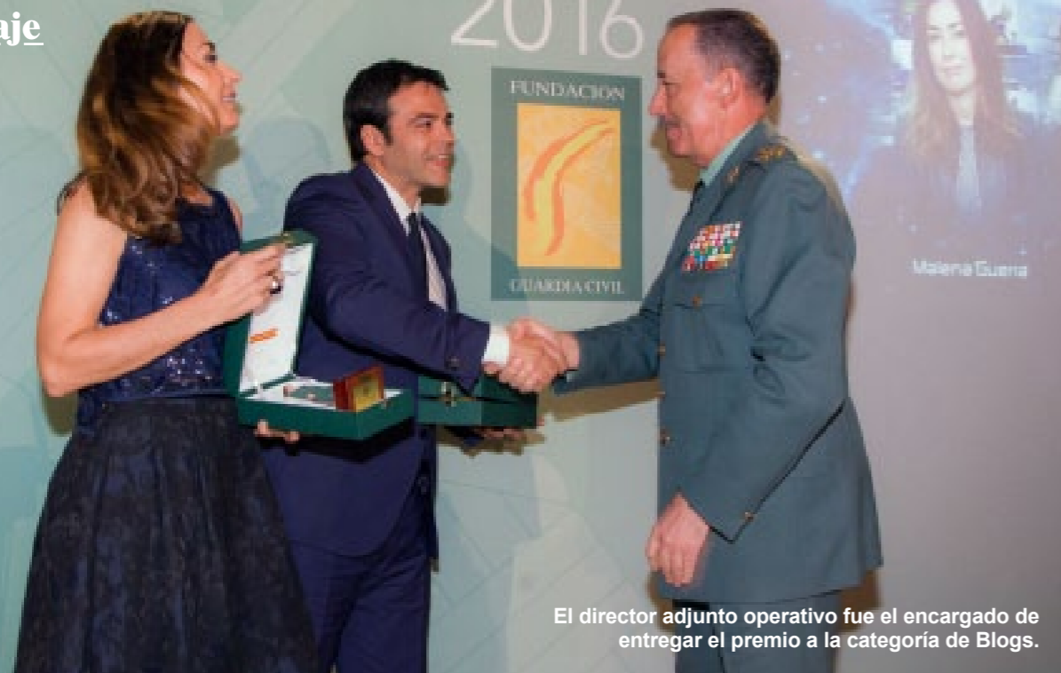
El director adjunto operativo fue el encargado de entregar el premio a la categoría de Blogs.